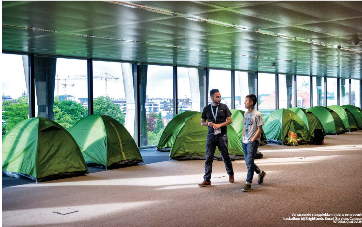
Verrassende slaapplekken tijdens een recente hackathon bij Brightlands Smart Services Campus.

Brightlands werkt veel samen met instituten als Universiteit Maastricht, Maastricht UMC+, Zuyd, Fontys, HAS, Leeuwenborgh, Citaverde, Arcus en Open Universiteit.